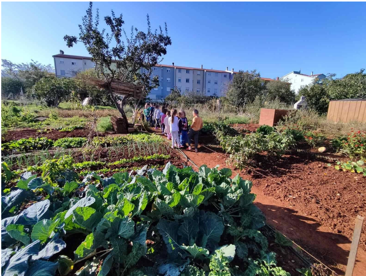
Posjet djece iz DV Vjeverice društvenom vrtu