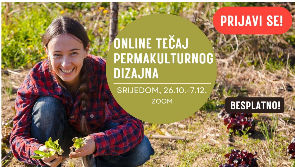
Najava tečaja permakulturnog dizajna, projekt "ZaVrtimo za inkluziju"