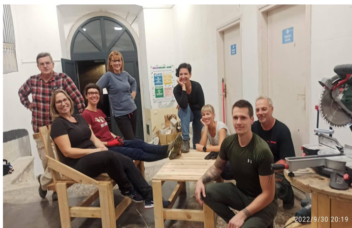
Samo dvije fotografije s brojnih radionica održanih u Radioni Re-Geppetto u Rojcu