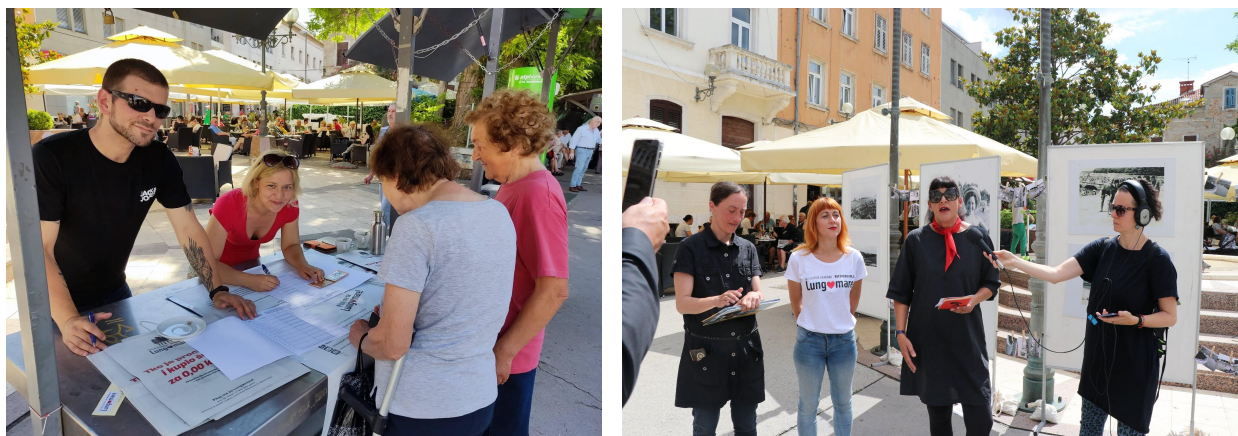
Prikupljanje potpisa za referendum Lungomare te otvaranje izložbe fotografija

U 2022. godini smo bili izuzetno aktivni u ovom području te smo podržali čak šest građanskih inicijativa diljem Istarske županije: Inicijativu građana Dajla-Karigador (protiv izgradnje dviju luka u uvali Dajla-Karigador), Inicijativa građana "Za Zeleni Umag" - izgradnja šetnice 45 km, Inicijativa građana "Za našu Prikodragu" - protiv širenja i otvaranja novih kamenoloma na području Općine Kanfanar, Inicijativa građana - Momjanski vinogradi - protiv izgradnje tursitičkog kompleksa na području zaštićenih momjanskih vinograda te Inicijativu građana Eko aktivisti Vodnjanštine po pitanju divljih odlagališta otpada i Inicijativa građana "Referendum za Lungomare" - u vrlo intenzivnoj kampanji za raspisivanje i provedbu prvog lokalnog referenduma u Puli.