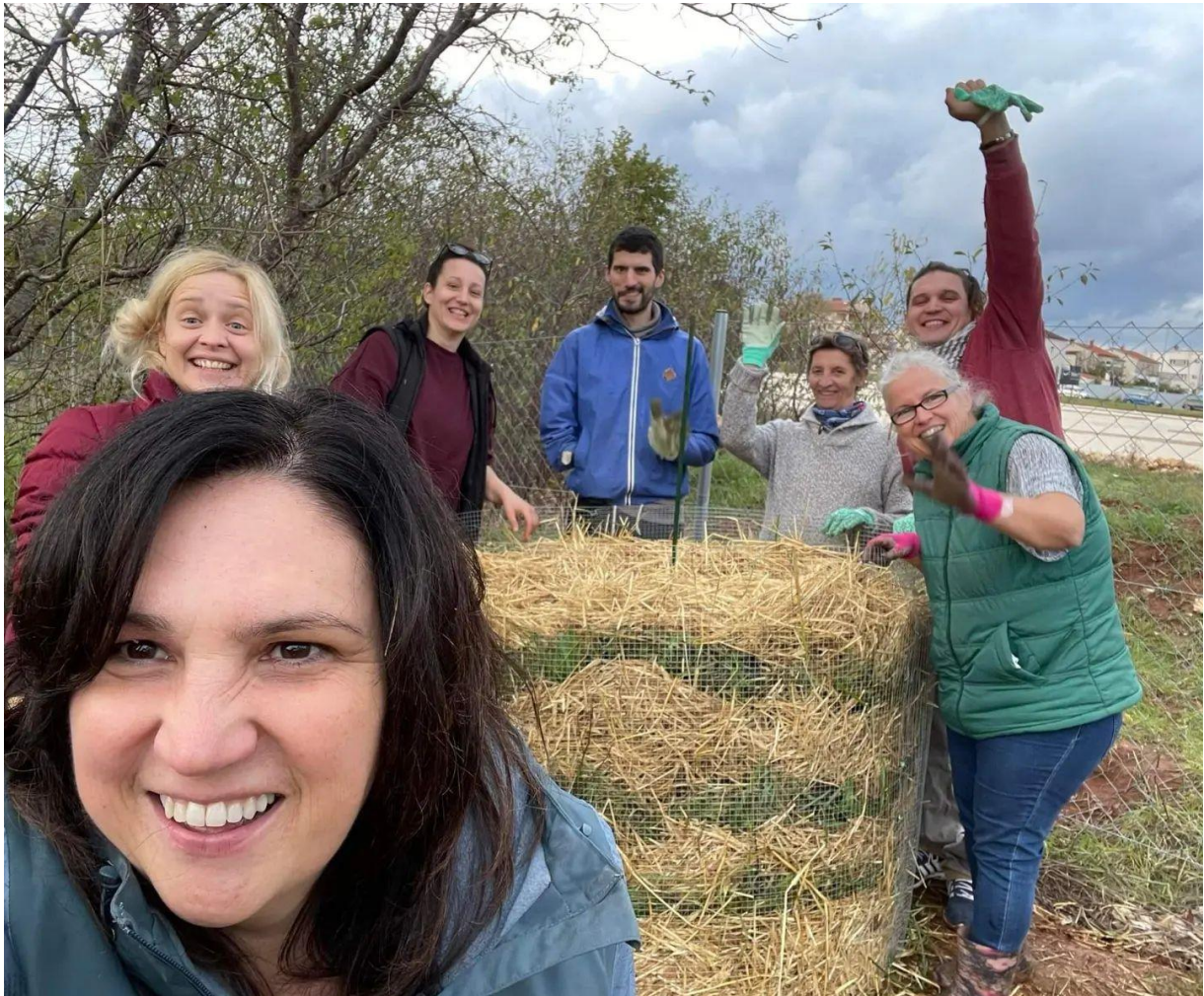
Volonteri u društvenom vrtu prilikom izrade kompostne hrpe