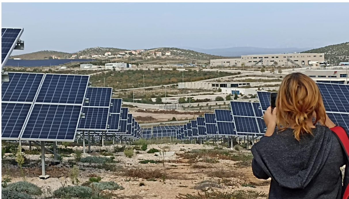
Studijsko putovanje u Šibenik u sklopu projekta METAR

Zelena Istra je u 2022. pristupila Mreži za pravednu i niskougljičnu tranziciju te podržala provedbu fokus grupe o problemima i rješenjima u kontekstu klimatskih promjena na lokalnoj razini, koja se u svibnju održala u Puli. Doprinijela je izradi jedne projektne publikacije (vinjete) te sudjelovala u organizaciji regionalnog okruglog stola u Puli 9. lipnja 2022. pod nazivom „ Lokalno planiranje za ublažavanje i prilagodbu klimatskim promjenama “, u suradnji s partnerima projekta “Climate Bridges” i METAR. Zajedno s partnerima Zelena Istra je podijelila i komentirala i nacrt smjernica za strukturirani dijalog koji je dovršen u siječnju 2023. Sudjelovala je na studijskom putovanju u Šibeniku na temu OIE i energetskog sustava RH (17.-19.10.). Više o projektu nalazi se na stranici Zelene Istre , kao i na mrežnoj stranici projekta .