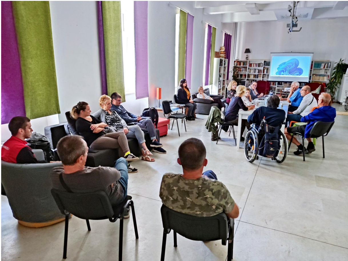
Obuka o radu s ranjivim skupinama -OSI i roditelji djece s teškoćama u razvoju, projekt "Za(VRT)imo za inkluziju"