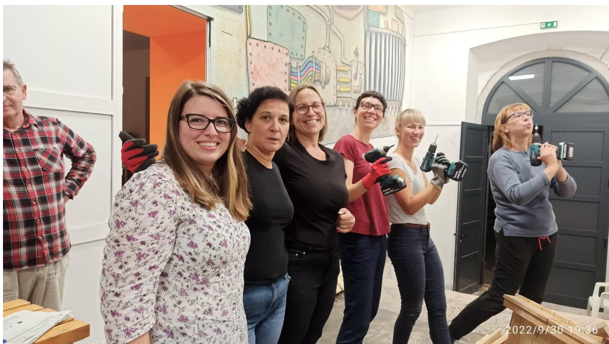
Gornja fotografija: detalj s radionice izrade namještaja od paleta

Projekt: R.O.J.C.: Razvijamo – Omogućavamo – Jačamo – Cijenimo