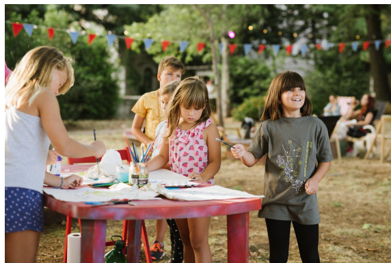
Fotografije s kreativne eko radionice oslikavanja platnenih vrećica, održane u Art parku Rojc u kolovozu 2022.