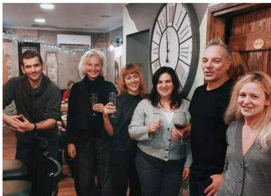
tim Zelene Istre

Završno, ali ne manje bitno, zahvaljujemo Vama članicama i članovima, našim volonterima te svim građankama i građanima na donacijama i podršci koju ste nam pružali i ove godine. Hvala Vam!