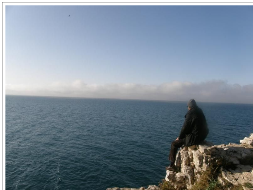
Slika 3. Blizina i promatranje velikih vodenih površina osnažuje, umiruje i doprinosi našem osjećaju blagostanja. Stoga bi i mjesta s kojih se u miru može promatrati more u gradovima trebalo biti više.