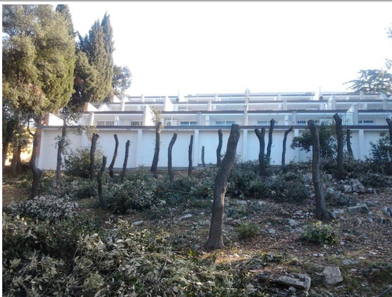
Slika 2. Barbarski pristup u turističkom naselju pored hotela Splendid u Puli, 2011. - porezana šuma da bi se omogućio pogled iz hotelskih soba na more užasnut će i svakog gosta

i drugih zelenih površina često je prepušteno nestručnim djelatnicima komunalnih poduzeća, turističkih i inih tvrtki koje na taj način ekološki osiromašuju ta područja.