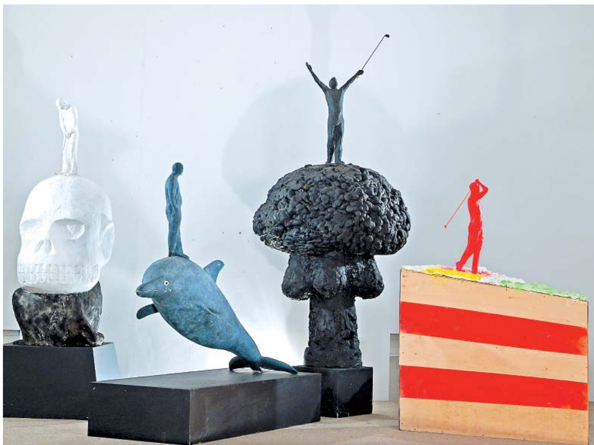
Dimenzije svih skulptura zajedno su cca. 350 x 300 x 300 cm.

Čime bih mogao argumentirati svoj optimizam osim vjerom da će se stvari promijeniti. Moraju, jer smo oboje upoznali druge ljude koji osjećaju istu potrebu i ne odustaju od želje za promjenom. Projekt sam bio završio, ali sam u toj želji našao razlog za nastavak.