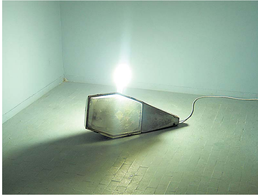
Svjetlosna instalacija "Ivana, ja sam optimist u vezi Pule", 2008. / 2009.

funkcionira poput palimpsesta. Svaka nova inicijativa ne surađuje s onom prethodnom, nego je briše. I obratno. Rekla si da sumnjaš da postoji dovoljno snage da Pula razvije sve svoje potencijale i identitete, od antičkog do vojnog grada. Nema vizije. Nema ljubavi prema sebi. I zato nisi optimist.