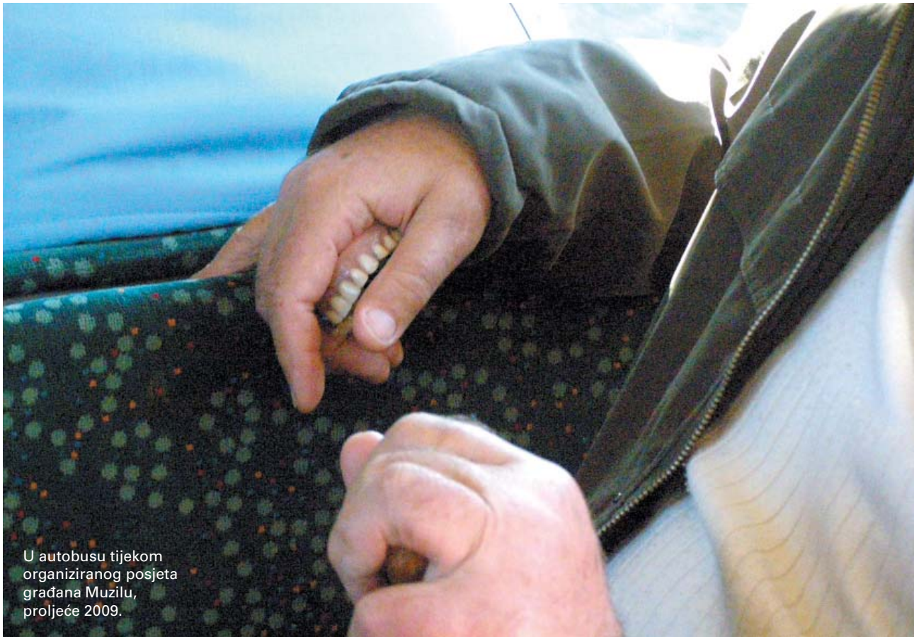
U autobusu tijekom organiziranog posjeta građana Muzilu, proljeće 2009.

OTVORENO PISMO GRAĐANSKE INICIJATIVE ZA MUZIL "VOLIM PULU" GRADONAČELNIKU PULE BORISU MILETIĆU I JAVNOSTI